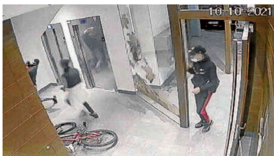
Estos jóvenes fueron a prisión en octubre por hacer el 'mataleón'.

ciones Penitenciarias primero y ahora el Gobierno vasco fomentan abiertamente el tercer grado. ¿Qué ha sucedido para que aumenten los ingresos en la cárcel? Hace meses que patrulleros de la Ertzaint-